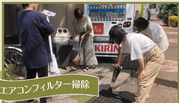
エアコンフィルター掃除

「あれ？そんなに汚れてないかも！」と思い掃除を始めてみると大変！どんどんほこりが出てきます。1階絵画教室も2階事務所もきれいにしたので、気持ちよくなります！