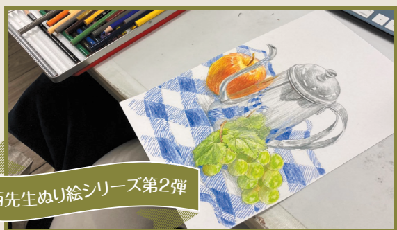
奥西先生ぬり絵シリーズ第2弾

「あれ？そんなに汚れてないかも！」と思い掃除を始めてみると大変！どんどんほこりが出てきます。1階絵画教室も2階事務所もきれいにしたので、気持ちよくなります！