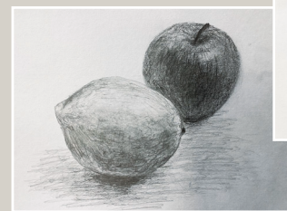
デッサンやクロッキーも基礎からお教えますので、はじめての方もお気軽にお申し込みくださいませ！