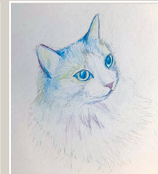
愛猫ちゃんをモデルに、あえて黒を使わずカラフルに塗っていただきました。

大人クラスでは、好きなモチーフを好きな画材で描いたり、基礎から学んだり、お子さんと一緒に参加されたりなど、二人一人に合った授業を行っています。