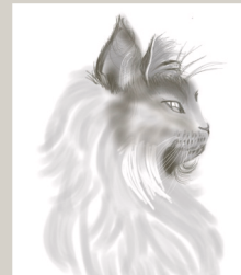
デジタルで凛々しいお顔の猫ちゃんを描いてくださいました！