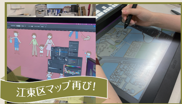
江東区マップ再び！

円錐型瓶のラベルのご依頼。扇型の展開図を作るため、円の直径を測り、正確な形を導き出します。ところが実際にプリントして当てがってみると、計算上正しいはずの形ではうまくいきません…!?