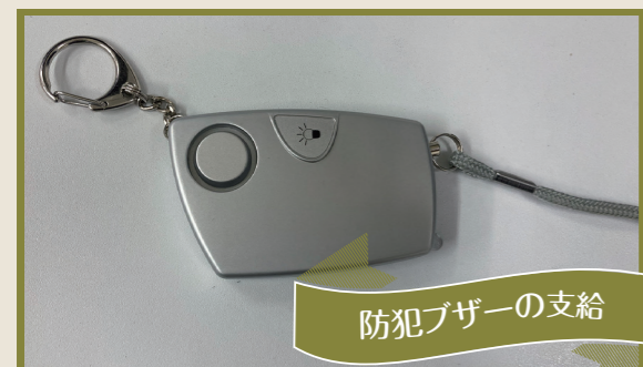
防犯ブザーの支給

色に強くなりたい！と思い、試験を受けることに。勉強時間を作るのは大変でしたが、カラーデザイン全般に関する面白い内容だったので楽しかったです！今後の仕事に生かしていきます。