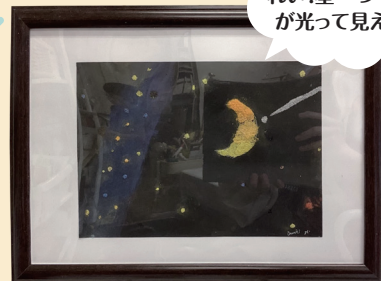
月のグラデーションがすごくきれいな星一つ一つが光って見える