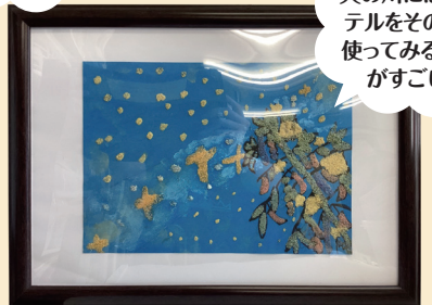
天の川にはパステルをそのまま使ってみる工夫がすごい！