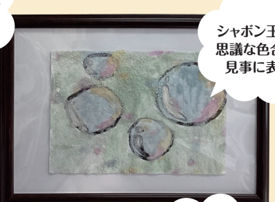
シャボン玉の不思議な色合いを見事に表現！