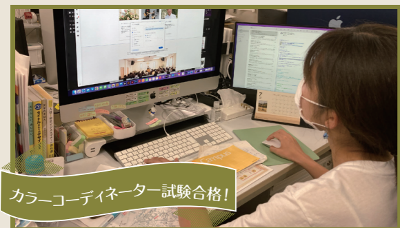
カラーコーディネーター試験合格！

色に強くなりたい！と思い、試験を受けることに。勉強時間を作るのは大変でしたが、カラーデザイン全般に関する面白い内容だったので楽しかったです！今後の仕事に生かしていきます。