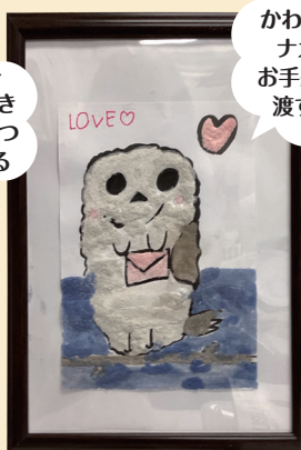
かわいいシメエナガちゃん。お手紙はだれに渡すのかな？