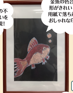
金魚の色合いや形がきれい！黒画用紙で落ち着いたおしゃれな印象に