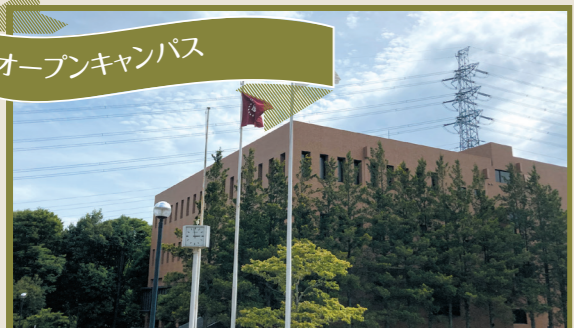
オープンキャンパス

エスプレッソが淹れられるコーヒーマーカーがやってきました！美味しいコーヒーでリラックスすると、いいアイデアが浮かびそうでモチベーションが上がります！